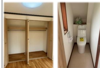
宅配ボックス・郵便ポスト 新規設置予定